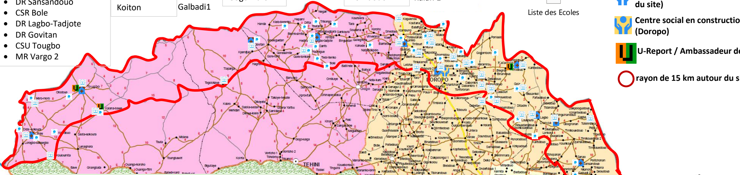
Services Sociaux autour de Notadouo (Ø 15 km)